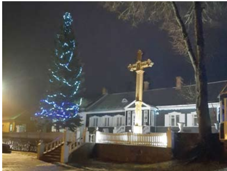
Skiemonių didžioji eglė.