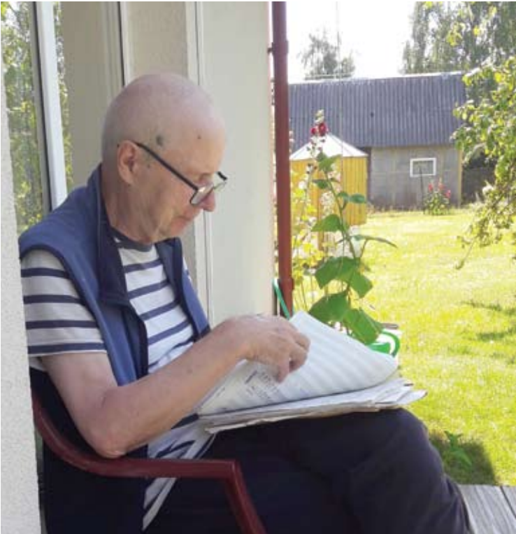
Balys Meldaikis - kompozitorius, rašantis muzikines improvizacijas.