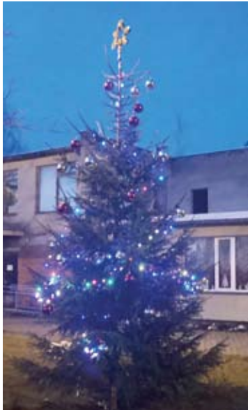
Bendruomenės papuošta eglutė Leliūnuose.

Naujienu portale anyksta.lt kviečiame skaitytojus pasidžiaugti seniūnijų žaliaskarėmis bei balsuoti už gražiausiai pasipuošusį rajono miestelį.