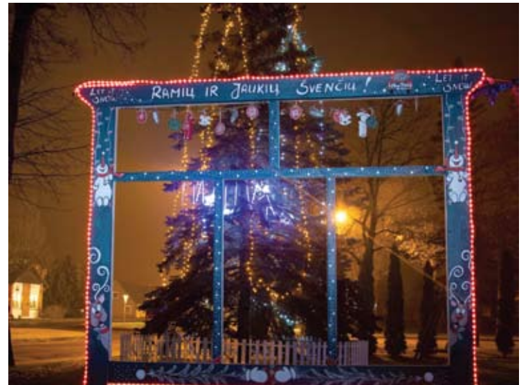
Svėdasų eglė su dekoracijomis.

(Nukelta į 13 psl.)