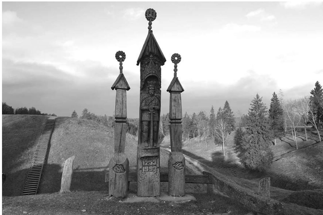
Į apleistą Šeimyniškių piliakalnį dėmesį atkreipė mokslininkai.